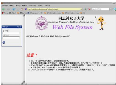
Xythos Webインターフェース ログイン画面